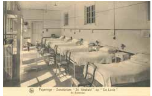
Ziekenzaal in het Sanatorium St. Idesbald op het kasteeldomein De Lovie

Ontdek via een uitgestippeld parcours de verschillende zorgvormen tijdens de belangrijkste periodes (1856 - heden) van het 60 ha grote kasteeldomein De Lovie. We nemen je mee naar de 19e-eeuwse burgerij, dompelen je onder in de Eerste Wereldoorlog, dragen zorg voor tbc-patiënten en eindigen met de huidige ondersteuning van jongeren en volwassenen met een verstandelijke beperking.