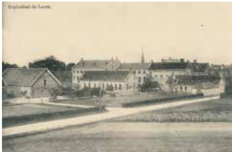
Huize Godtschalck in 1913

In Heuvelland zet De Loods, het vroegere Huize Godtschalck, haar deuren open. De gidsen nemen je mee naar het rijke verleden van deze site: als klooster, als bejaardeninstelling, als veldhospitaal tijdens de Eerste Wereldoorlog en tot slot als instelling voor de Bijzondere Jeugdzorg. Geniet na met koffie of frisdrank.